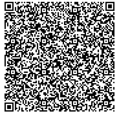
Certificat COVID numérique UE

Nom(s) de famille et prénom(s) Name, Surname(s) and forename(s)